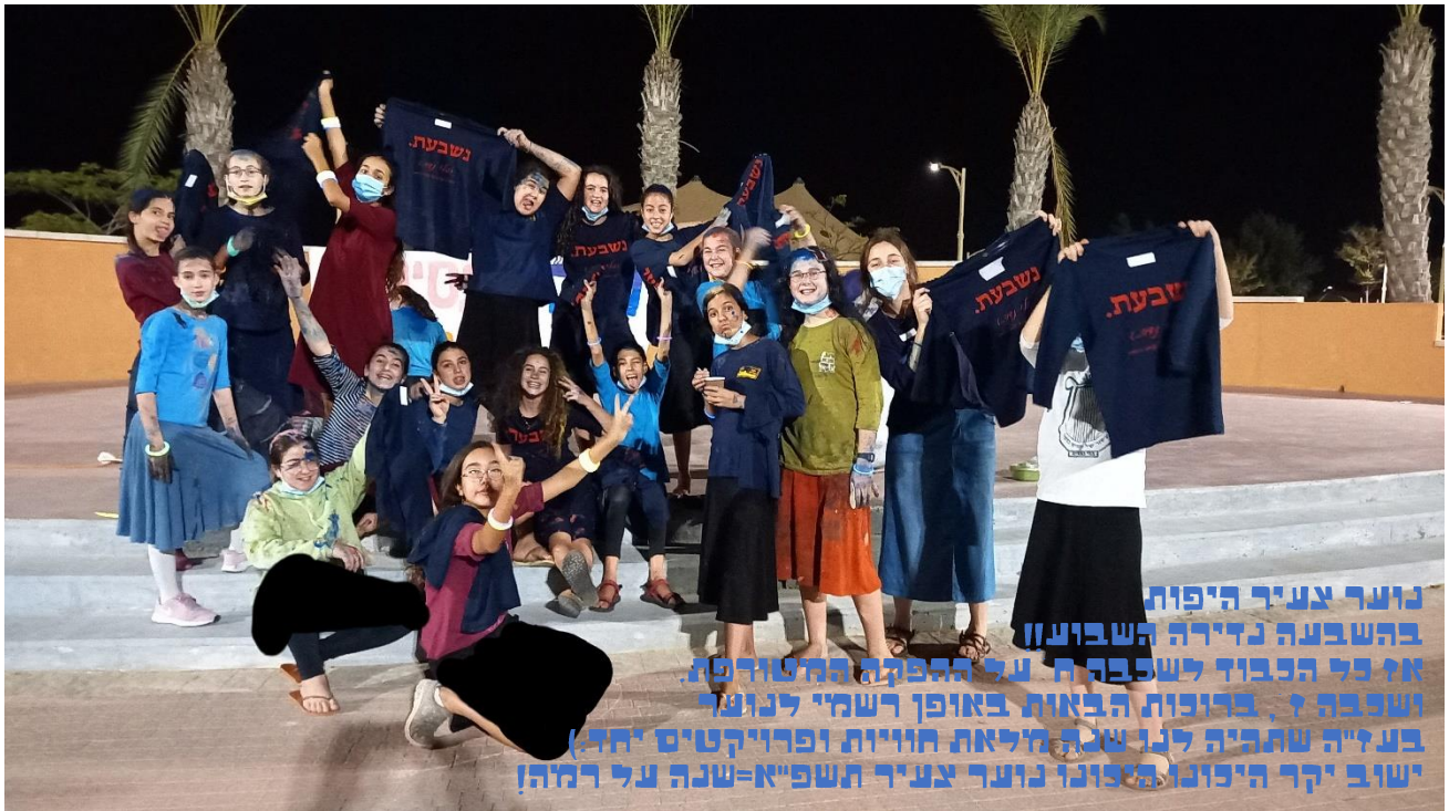
נוער צעיר היפות בהשבעה נדירה השבועון אז כל הכבוד לשכבה ח על ההפקה המטורפת ושכבה ז ברוכות הבאית באופן רשמי לנוער בעז"ה שתביא לנו שנה מילאת חויזית ופרויקטים יחד ישוב יקר היכוננו לצוננו נוער צעיר תשפ"א=שנה על רמה!